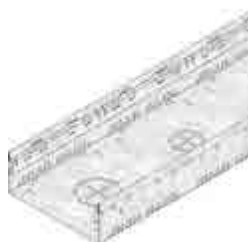
Típus 100, horganyzott