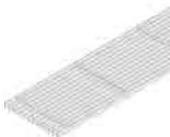
Horganyzott hosszanti bordás rács