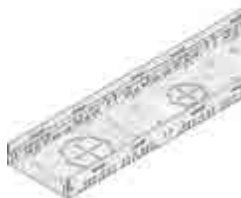
Típus 45, horganyzott