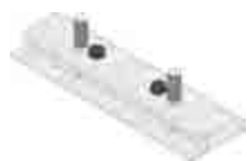
Beszabályozókészlet, DACHFIX STEEL 155, típus 45, horganyzott (2 db/fm alkalmazása szükséges)

A rozsdamentes acél anyag minősége megfelel a CNS 1.4301 vagy CNS 1.4307 szabványnak.