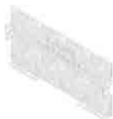
Zárt véglemez, típus 75, horganyzott