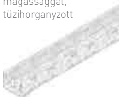
Típus 75, állítható magassággal, tüzhorganyzott

A rozsdamentes acél anyag minősége megfelel a CNS 1.4301 vagy CNS 1.4307 szabványnak.