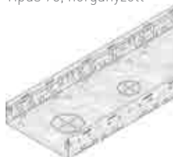
Típus 75, horganyzott