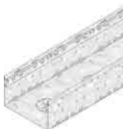
Típus 150, horganyzott