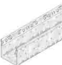
Típus 150, horganyzott