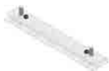
Magasságszabályzó készlet DACHFIX STEEL 255, típus 45, horganyzott (2 db szükséges méterenként)