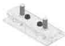
Beszabályozókészlet DACHFIX STEEL 115, típus 45 [2 db/fm alkalmazása szükséges]

A rozsdamentes acél anyag minősége megfelel a CNS 1.4301 vagy CNS 1.4307 szabványnak.