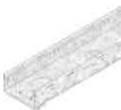
Típus 75, állítható magassággal, tűzhorganyzott

A rozsdamentes acél anyag minősége megfelel a CNS 1.4301 vagy CNS 1.4307 szabványnak.