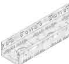
Típus 100, horganyzott

A rozsdamentes acél anyag minősége megfelel a CNS 1.4301 vagy CNS 1.4307 szabványnak.