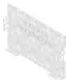
Zárt véglemez, típus 75