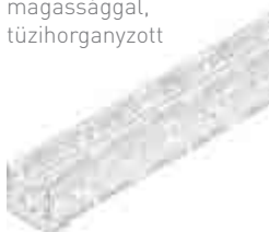
Típus 100, állítható magassággal, tüzhorganyzott

A rozsdamentes acél anyag minősége megfelel a CNS 1.4301 vagy CNS 1.4307 szabványnak.