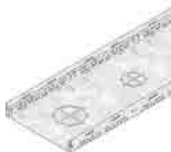
Típus 45, horganyzott