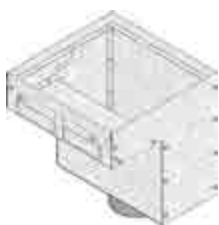
Összefolyóelem Típus 45,75