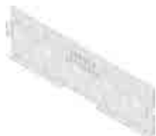
Véglemez típus 75, zárt, horganyzott