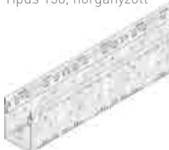
Típus 150, horganyzott

A rozsdamentes acél anyag minősége megfelel a CNS 1.4301 vagy CNS 1.4307 szabványnak.