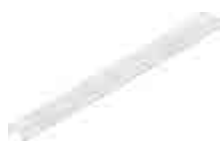
Bevezető csatorna, horganyzott

A rozsdamentes acél anyag minősége megfelel a CNS 1.4301 vagy CNS 1.4307 szabványnak.