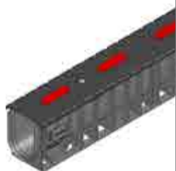
SUPER típus 010